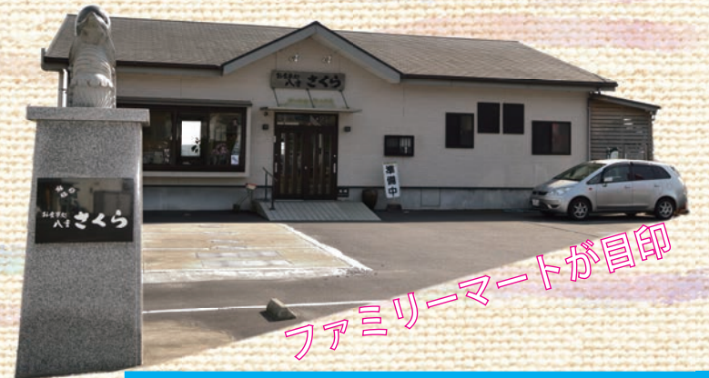
ファミリーマートが冒印

〒899-3101 鹿児島県日置市日吉町日置3213-1 県道37号線沿い城の下バス停前 TEL/FAX(099)292-3811 定休日/月曜日 営業時間/11:00～14:00 17:30～21:00 ●テーブル6台 24席 ●和室 40席 ●掘りごたつ2台 12席