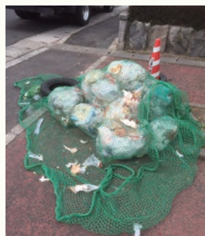
ごみを出される際は猫やカラスによって、写真の様に散らからないようにネットをしっかりと被せてください。