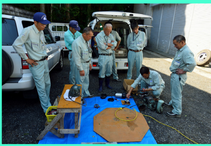
実演者の作業を見守り中