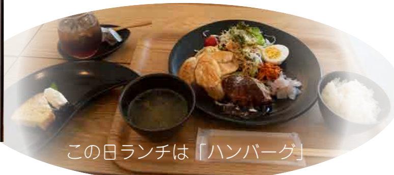
この日ランチは「ハンバーグ」