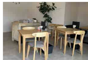
白を基調とした明るい店内